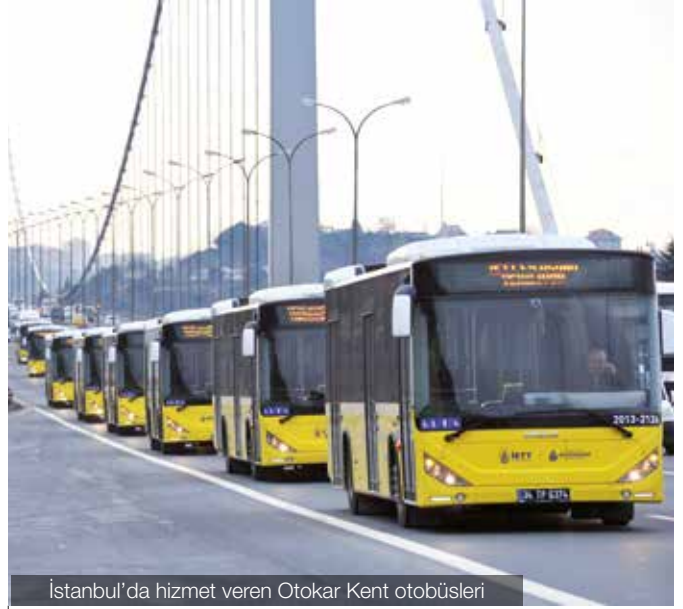
İstanbul'da hizmet veren Otokar Kent otobüsleri

Otokar, 2013'te MİLLİ TANK ALTAY'ın prototiplerinin testlerine de devam ederek önemli aşamaları başarıyla tamamlamıştır. Türkiye'nin milli ana muharebe tankı ALTAY projesinde ana yüklenici olan Otokar, 2013'te de proje takvimine paralel olarak çalışmalarına devam etmiştir. Üç aşamadan oluşan projede ikinci aşama olan "Detay Tasarım Aşaması" 2013 yılında tamamlanmış; projenin son aşaması olan "Prototipleme ve Kalifikasyon Aşaması" konusunda çalışmalar sürdürülmüştür. Üretilen ilk iki prototip üzerinde hareket ve atış konusundaki testler 2013 boyunca devam etmiştir. ALTAY, Mart ayında Sankamış'taki kış testlerini başarı ile tamamlamıştır. 2014 yılında atış testleri sürecektir. ALTAY'da testlerden elde edilen bilgiler doğrultusunda iki prototip daha üretilecektir. Tamamlandığında dünyanın en modern ve üçüncü nesil üzerinde bir ana muharebe tankı olacak ALTAY'ın tasarım, prototipleme ve kalifikasyon döneminin 2015 yılında tamamlanması planlanmaktadır.