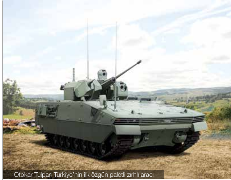
Otokar Tulpar, Türkiye’nin ilk özgün paletli zırhlı aracı

Türkiye’nin ilk şehirlerarası otobüsü, ilk zırhlı taktik aracı gibi yeniliklerini gerçekleştiren Otokar 2013’te 50’nci kuruluş yıldönümünü kutlamıştır. %40 büyümeyle 1.402 milyon TL ciroya ulaşan Şirket, 117 milyon ABD Doları ihracat gerçekleştirmiştir. Cirosunun %5’ini Ar-Ge faaliyetlerine ayıran Otokar, ürün gamını yeni ürünlerle zenginleştirmiştir.